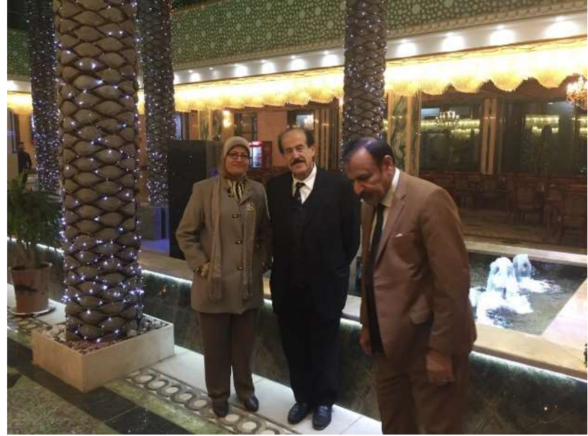
Conference Dinner for Abroad Participants