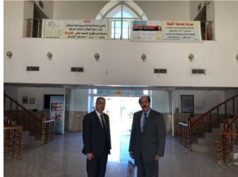
عميد كلية الطب واطباء فرع طب المجتمع