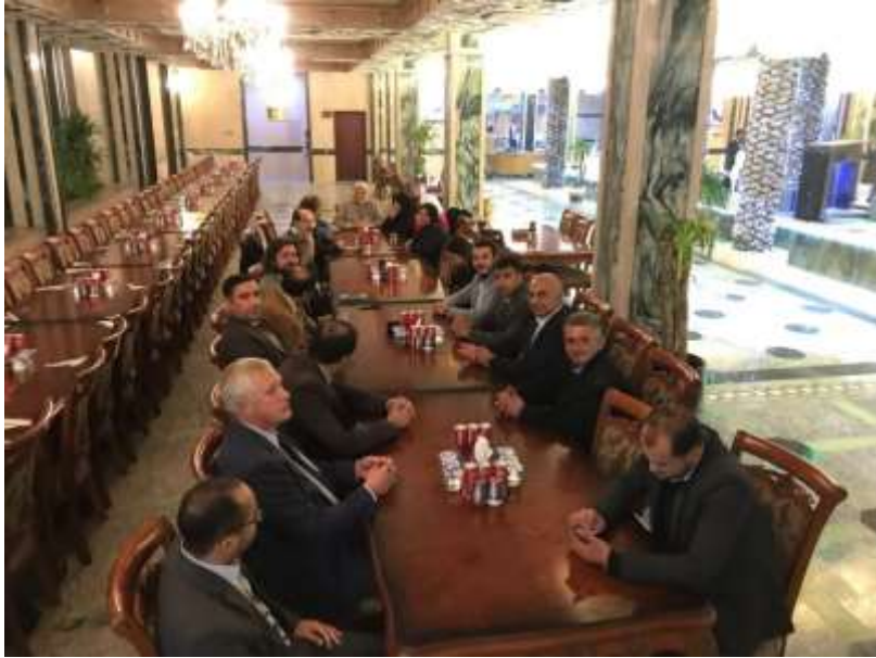
Conference Lunch on Tigger River