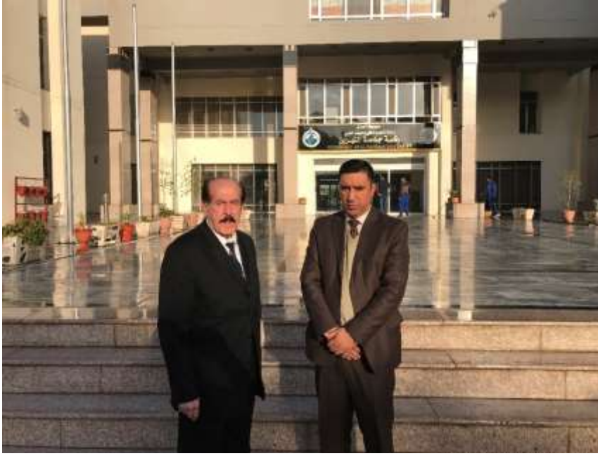
أمامى رئاسة جامعة النهريين